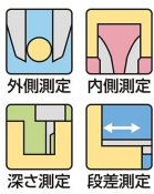
外側測定 内側測定 深さ測定 段差測定