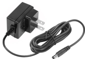
株式会社エー・アンド・デイ