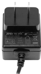
株式会社エー・アンド・デイ