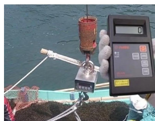
画像は、リモコンの使用イメージです。