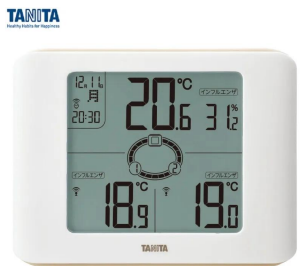
画像は、親機正面のイメージです。