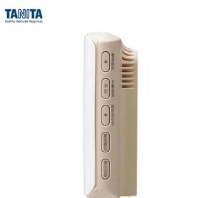
画像は、親機側面のイメージです。