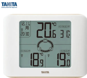
株式会社 タニタ 画像は、親機正面のイメージです。