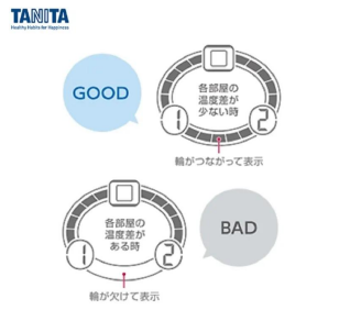
温度差が5以内の時、画面中央にある輪がつながります