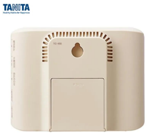
株式会社 タニタ 画像は、親機背面のイメージです。