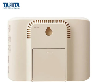
画像は、親機背面のイメージです。