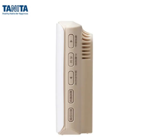
株式会社 タニタ 画像は、親機側面のイメージです。