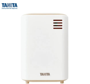
株式会社 タニタ 画像は、子機正面のイメージです。