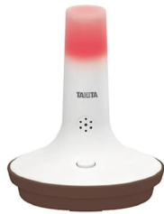
画像は、熱中症の危険を知らせる光が点灯したイメージです。