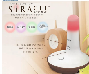
画像は、商品機能のイメージです。