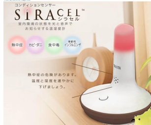
画像は、商品機能のイメージです。