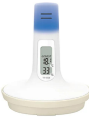
本体背面と季節性インフルエンザの危険を知らせる光が点灯したイメージです。