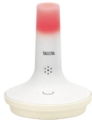
画像は、熱中症の危険を知らせる光が点灯したイメージです。