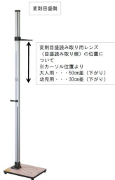
有限会社 吉田製作所