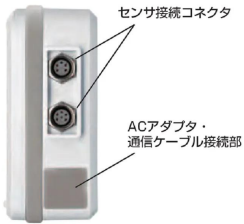
画像は、商品側面のイメージです。