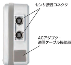
センサ接続コネクタ