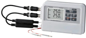
CH1: SK-L753-1 センサ CH2: SK-L753-2 センサ ※センサは別売ります