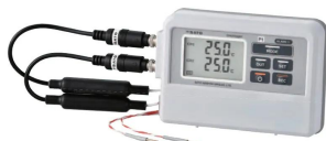
CH1: SK-L753-1 センサ CH2: SK-L753-2 センサ ※センサは別売りです