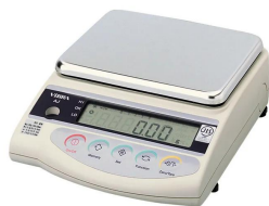
写真は、シリーズ代表画像です。