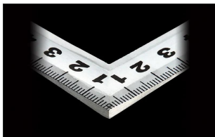
画像は、角厚のイメージです。