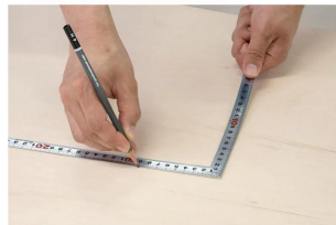
画像は、商品の使用イメージです。