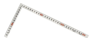
画像は、商品裏面のイメージです。