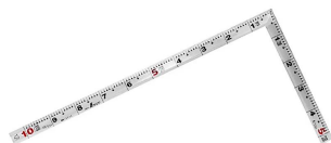
画像は、商品表面のイメージです。