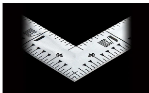
シンワ測定株式会社 画像は、直角のイメージです。