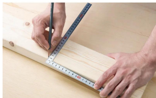
画像は、商品の使用イメージです。