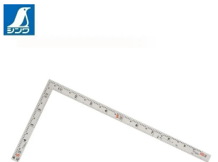
画像は、商品裏面のイメージです。