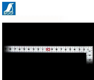
画像は、目盛のイメージです。