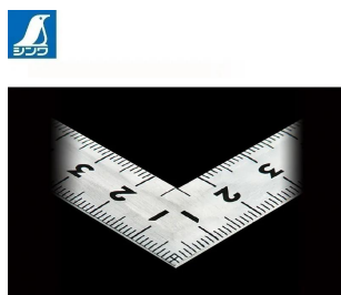
画像は、直角のイメージです。