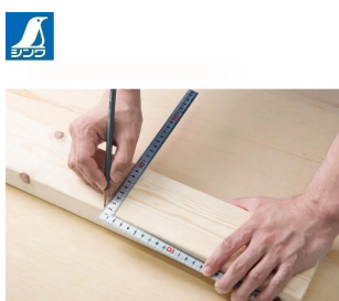
画像は、商品の使用イメージです。