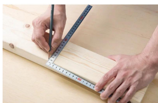
画像は、商品の使用イメージです。