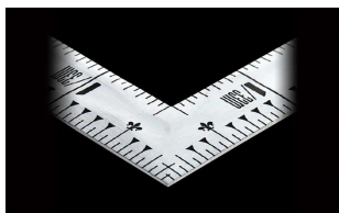
画像は、直角のイメージです。