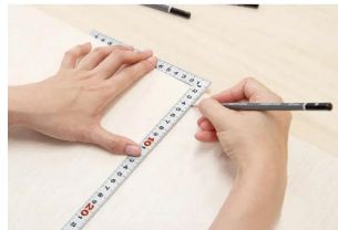
画像は、商品の使用イメージです。