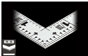
シンワ測定株式会社 画像は、直角のイメージです。