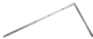
画像は、商品表面のイメージです。