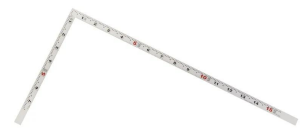
画像は、商品裏面のイメージです。