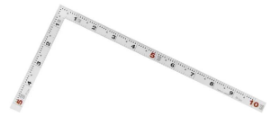
画像は、商品裏面のイメージです。