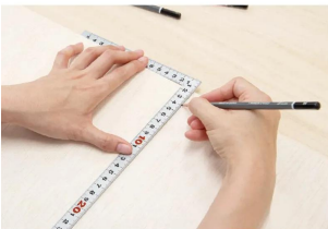
画像は、商品の使用イメージです。