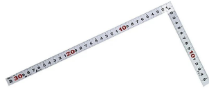
画像は、商品表面のイメージです。