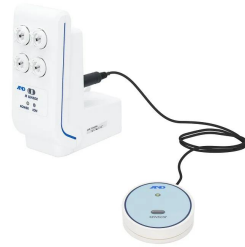
株式会社 エー・アンド・デイ