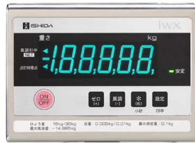
画像は、表示部のイメージです。